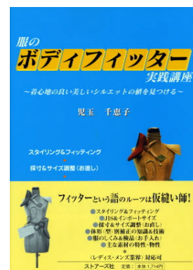
○教育研修用テキスト (ストアーズ社刊)